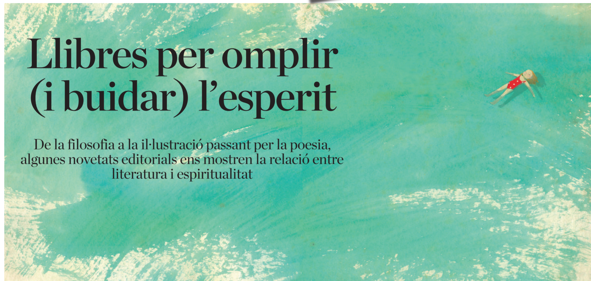
Il·lustració de coberta de 'La gota d'aigua' (Akiara Books). INES CASTEL-BRANCO

De la filosofia a la il·lustració passant per la poesia, algunes novetats editorials ens mostren la relació entre literatura i espiritualitat