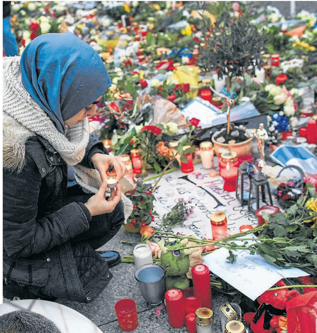
Es l'atemptats de París al 2015 són el punt de partida de l'última obra de Benzine.

L'obra és senzilla, colpadora: Lettre à Nour és una sèrie de cartes que s'intercanvien un pare i la seva filla. Un diàleg en la distància, ella a Faluja, ell en algun lloc indeterminat; ella entregant la seva vida per una causa que creu justa, ell greument consternat quan veu que aquella causa no només no encaixa amb els seus valors vitals, sinó que amb el pas del temps la mateixa causa és només una mascarada que amaga terror i fanatisme... L'obra és una adaptació teatral del llibre Nour, pourquoi n'ai-je rien vu venir? (Seuil), que Benzine va començar a escriure arran dels atemptats de París del 2015. "Per què hi ha joves, homes i dones, que decideixen anar a un país en guerra i matar en nom d'un Déu que també és el meu? Aquesta és una pregunta obsessiva, recurrent, que no em deixava en pau. Així que vaig posar-me a imaginar aquest diàleg difícil, potser impossible, entre un pare i la seva filla", explica l'escriptor, que és també un dels islamòlegs més destacats i implicats en el diàleg interreligiós de l'Europa actual. Catorze cartes entre un pare, com el mateix autor, professor universitari, musulmà practicant, que viu la seva religió com un missatge d'obertura i de respecte als altres i la seva filla que marxa a l'Irak acompanyar l'home amb qui s'acaba de casar per entrar a les files del Daïch. No és un diàleg fàcil, però a mesura que succeeix l'obra anem veient com les conviccions de la jove