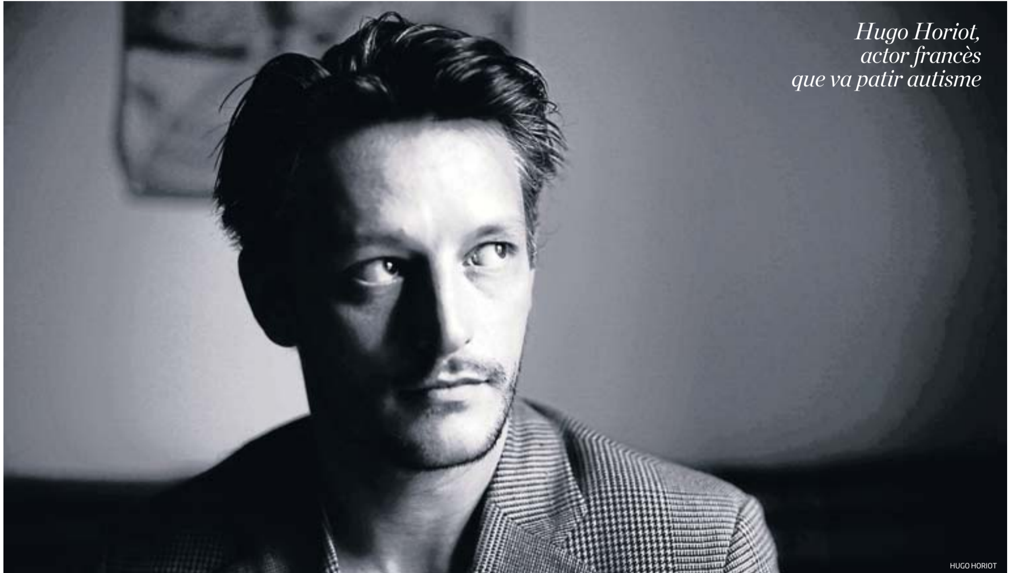
Hugo Horiot, actor francès que va patir autisme

disciplina física practicada arreu del món. Un text universal, compost d'aforismes i traduït per primer cop al català, que va més enllà dels pressupòsits culturals i religiosos de l'Índia i que ofereix una anàlisi exhaustiva de la ment i de la seva relació amb el cos.