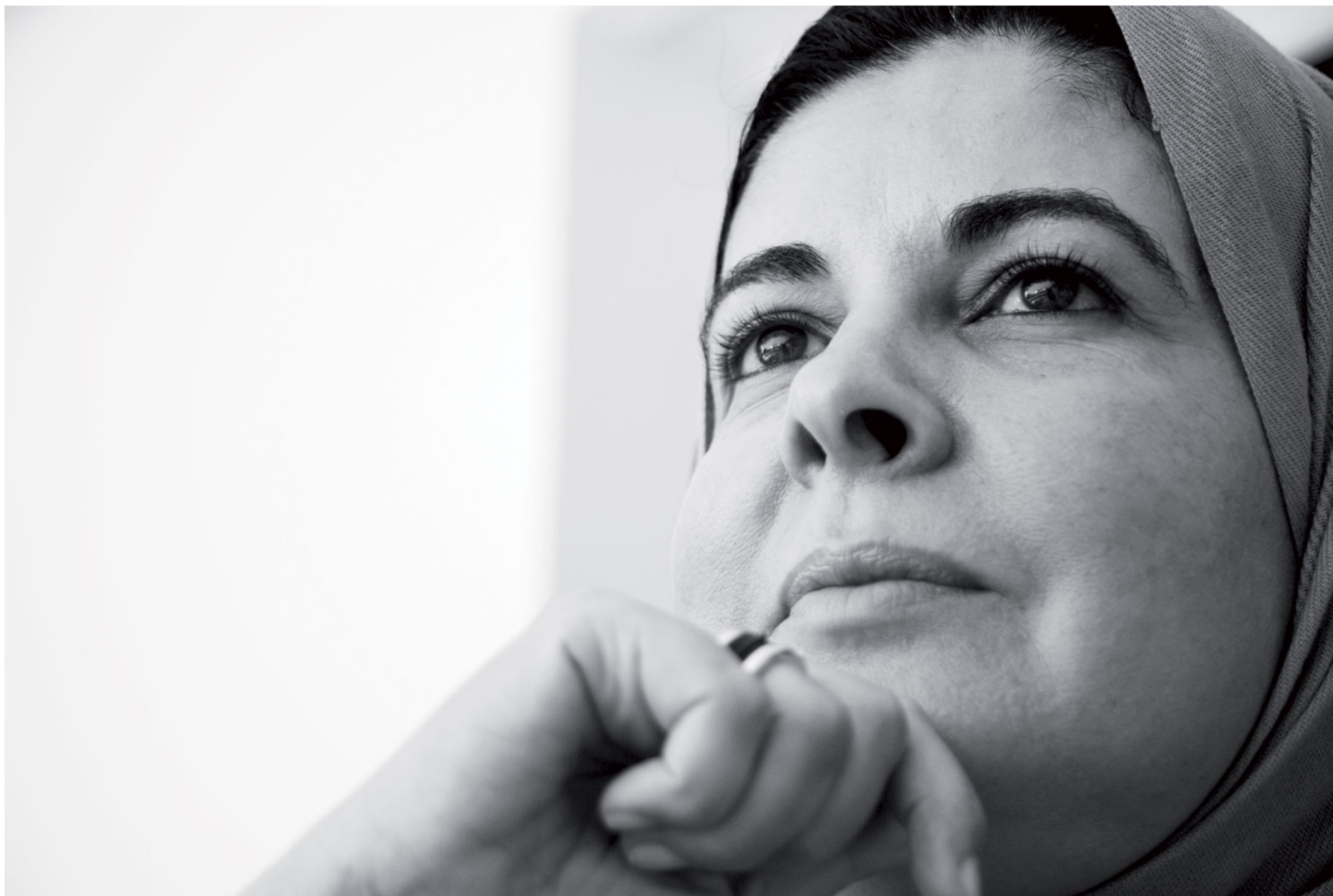
Asma Lamrabet és metgessa i una coneguda intel·lectual marroquí fa una lectura igualitària i alliberadora de l'islam. ASMA-LAMRABET.COM